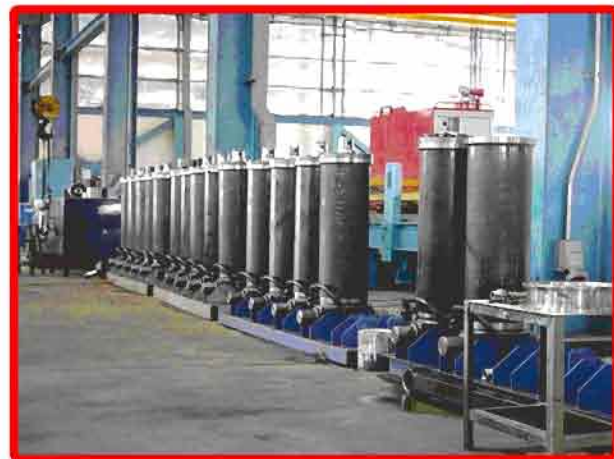
▲ เสือกระบอกเส้นผ่าศูนย์กลางภายในขนาด 220 มม. (แท้จาก Japan)