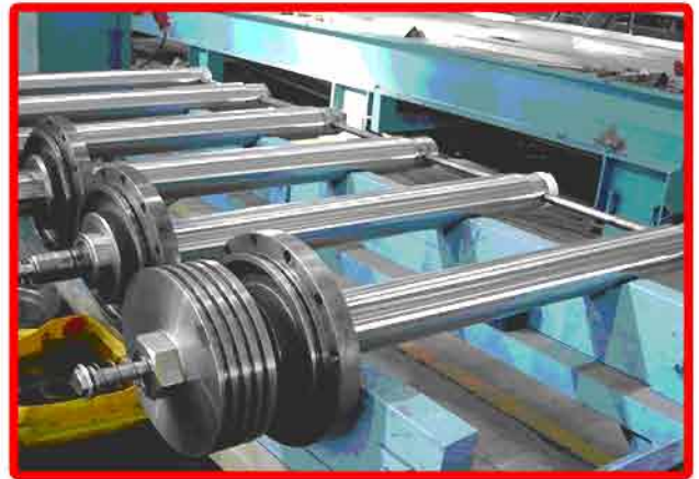
▲ แกนกระบอกขนาดเส้นผ่าศูนย์กลาง 85 มม.