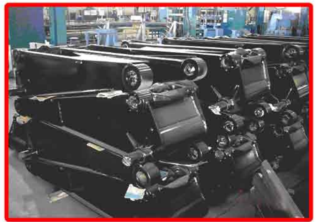
▲ ชุดกระบอกไฮดรอลิกสำหรับกระบะดั้มพ์ 10 ล้อ